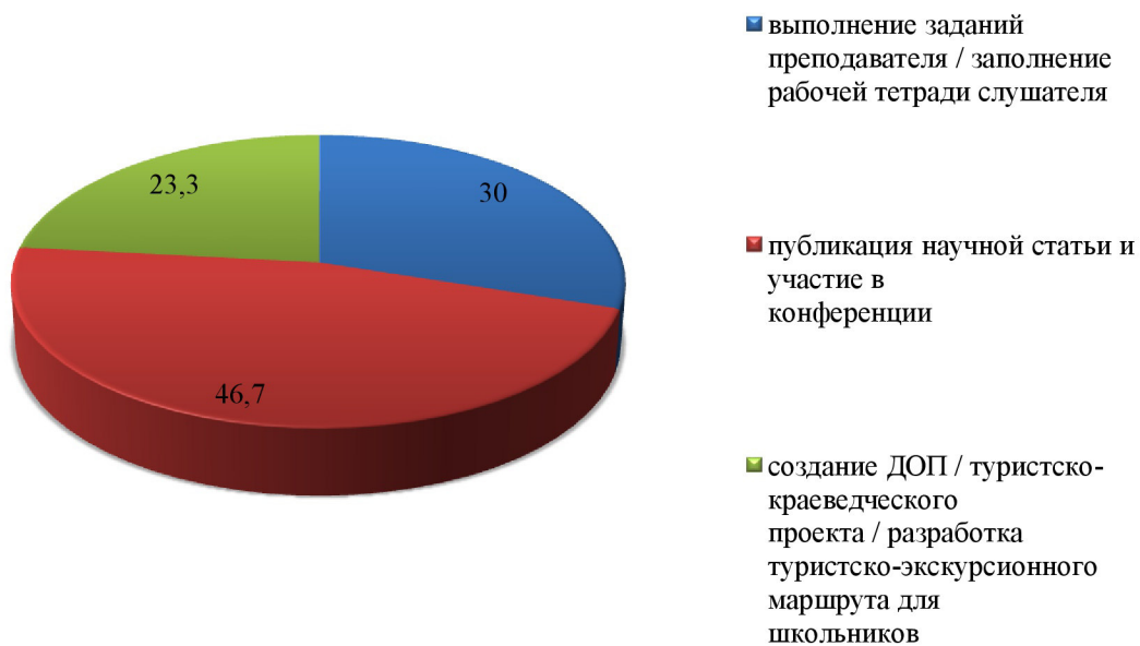
Рис. 4. Предпочитаемые слушателями формы итоговой аттестации (в процентном соотношении)