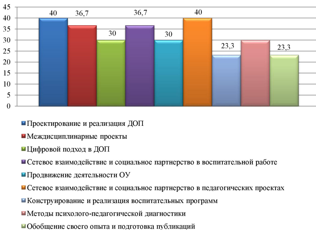
Рис. 2. Распределение тем, по которым слушатели испытывают трудности (в процентном соотношении)

Третий вопрос также предполагал возможность выбрать слушателям несколько вариантов ответа. Он был посвящен трудностям формирования основных элементов ДОП и программ воспитания. Половина слушателей (15 чел.) отметили, что выбор соответствующих методов и методических приемов для реализации целей программы – наиболее сложная задача при составлении ДОП. Также практически для половины слушателей (14 чел.) трудность представляет выявление особенностей в содержании программы. Значительная часть слушателей (12 чел.) нуждается в повышении профессиональной компетентности по вопросу разработки оценочных средств. Формулировку актуальности, новизны программы в качестве проблемного вопроса отметили (11 чел.). Шестеро слушателей отметили, что испытывают проблемы только в формулировке цели и задач рабочей программы, а также цели и задач ДОП и программ воспитания. Двое слушателей не испытывают проблем в формировании ключевых компонентов и разделов ДОП и программ воспитания. Один слушатель добавил свой вариант ответа: «Все варианты, только в дошкольном учреждении» (рис. 3).