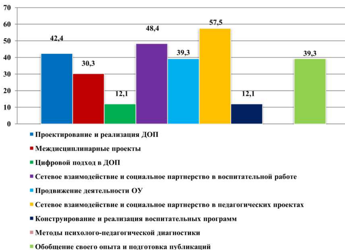
Рис. 2. Распределение тем, по которым слушатели испытывают трудности (в процентном соотношении)

Третий вопрос также предполагал возможность выбрать слушателям несколько вариантов ответа. Он был посвящен трудностям формирования структурных элементов образовательной программы. Слушатели преимущественно (15 чел.) согласны с тем, что выбор соответствующих методов и методических приемов для реализации целей программы – наиболее сложная задача при составлении ДОП. Другие варианты ответа представлены следующим образом: выявление особенностей в содержании программы (12 чел.), формулировка актуальности, новизны, разработка оценочных средств (10 чел.), формулировка цели и задач рабочей программы (9 чел.), формулировка цели и задач ДОП и программ воспитания (8 чел.). Пятеро слушателей отметили, что не испытывают проблем в составлении и реализации ДОП и программ воспитания. Один слушатель добавил свой вариант ответа: «Обоснование принципов сетевого и социального партнерства при конструировании ДОП». Двое слушателей затруднились с ответом (рис. 3).