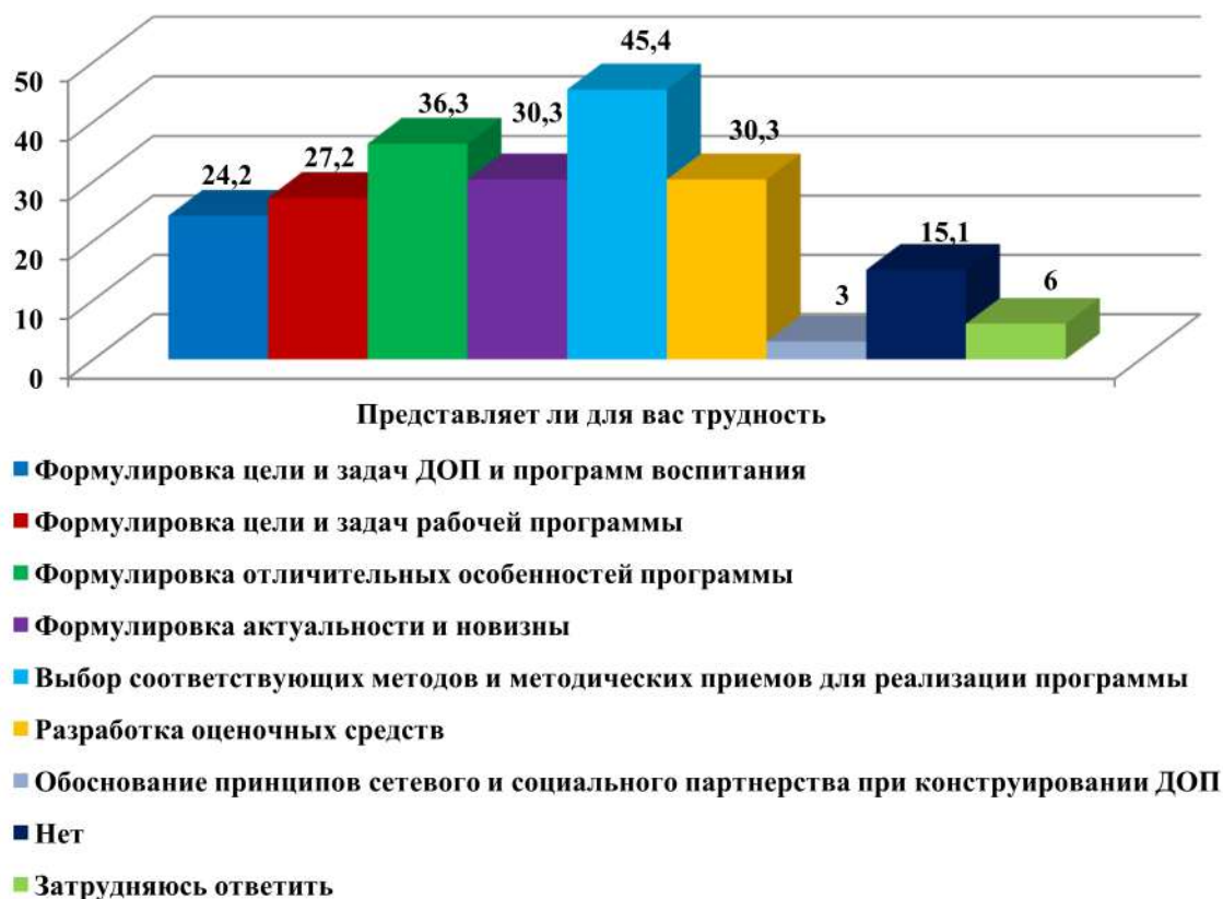
Рис. 3. Трудности, возникающие у слушателей при составлении образовательных программ (в процентном соотношении)

В четвертом вопросе слушателям предлагалось выбрать предпочтительные формы повышения квалификации, от наиболее важной к наименее значимой. У большинства слушателей на первом месте поставлено самообразование (51,5%). Второе место равнозначно распределено между практико-ориентированными мероприятиями и дистанционным обучением (36,3%). На третье место слушатели поставили индивидуальную помощь со стороны тьютора (27,2%). При этом несколько слушателей (9%) выбрали для себя онлайн-обучение как единственно возможную форму повышения профессиональной компетентности. Наименее важными для слушателей, согласно опросу, являются мастер-классы, предметные методические объединения и творческие лаборатории.