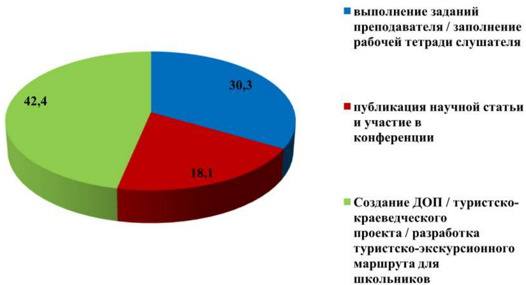
Рис. 4. Предпочитаемые слушателями формы итоговой аттестации (в процентном соотношении)