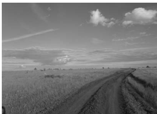
Просторы Гагинского района

Туризм обладает огромным воспитательным потенциалом. Он приучает детей переносить бытовую неустроенность, преодолевать различные трудности, брать на себя ответственность за общее дело; учит бережному отношению к родной природе и памятникам культуры, рациональному использованию своего времени, сил, имущества; формируют навыки труда по самообслуживанию; способствуют развитию самостоятельности обучающихся.