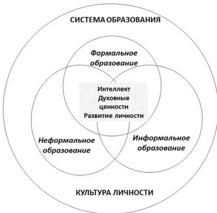
Рис. Взаимодействие всех форматов образования (составлено автором)

Keywords: formats of education, formal, non-formal, informal, common features and differences of these formats, priority of education.