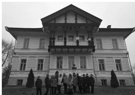
Экскурсия в усадьбу барона Жомини (пос. Баронский, Гагинский район)

Мы с детьми совершаем различные экскурсии, например, по достопримечательным местам Гагинского района: усадьба барона Жомини (пос. Баронский), поместье Пашкова (с.Ветошкино), дом деда В.И.Ленина в с.Андросо-