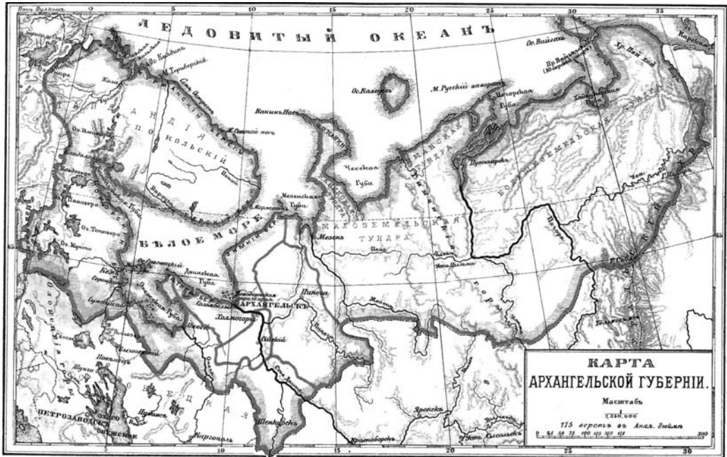
Карта 2. Архангельская губерния

бернатор в России). К этой же провинции были отнесены Копорский и Ямбургский уезды, руководимые совместно воеводой и ландрихтером (провинциальным судьёй). Таким образом, во времена Петра I Санкт-Петербург управлялся отдельно от своей губернии, хотя формально числился в её составе.