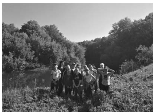
Поход по родным местам