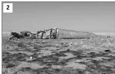
Рис 1. Место падения первой ступени РН «Протон-М» (декабрь 2021 г.)