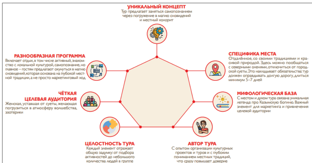
Рис. 1. Сильные стороны проекта «По сакральным тропам души»

В качестве примера креативного тура представлен Женский тур-семинар с погружением в мир хантыйских сновидений «По сакральным тропам души» (рис. 1), разработанный на базе села Казым (Ханты-Мансийский автономный округ), где живут около тысячи хантов (общая численность этноса – 30 тысяч человек).