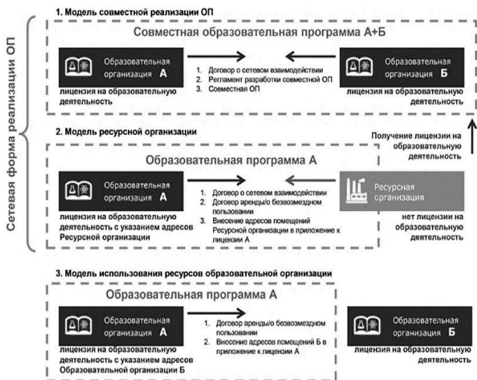
Рис. 1. Модели совместной реализации программ 35

или модульными. Каждая организация отвечает за результат освоения обучающимися «своего» модуля или уровня ДООП.