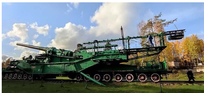
Рис. 5. Форт Красная Горка: 305-мм установка ТМ-3-12 на железнодорожном транспортёре.