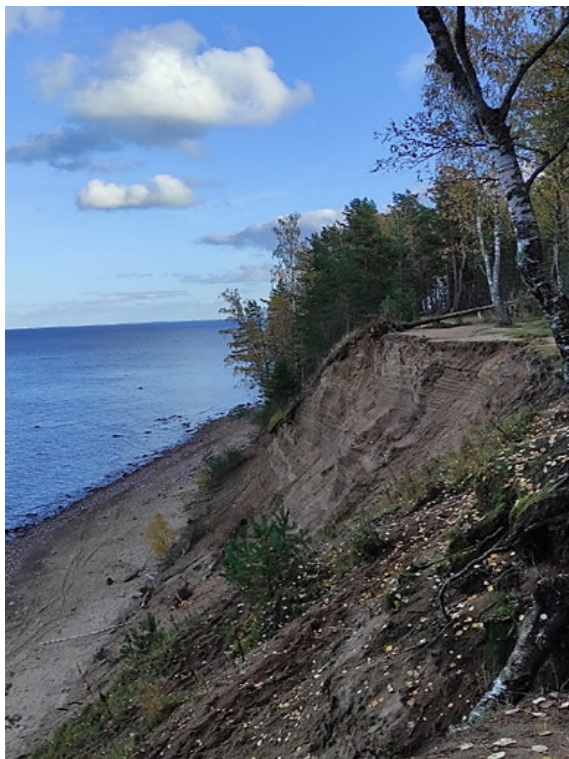
Рис. 4. Форт Красная Горка. Активный абразионный уступ высотой 26 м над уровнем моря