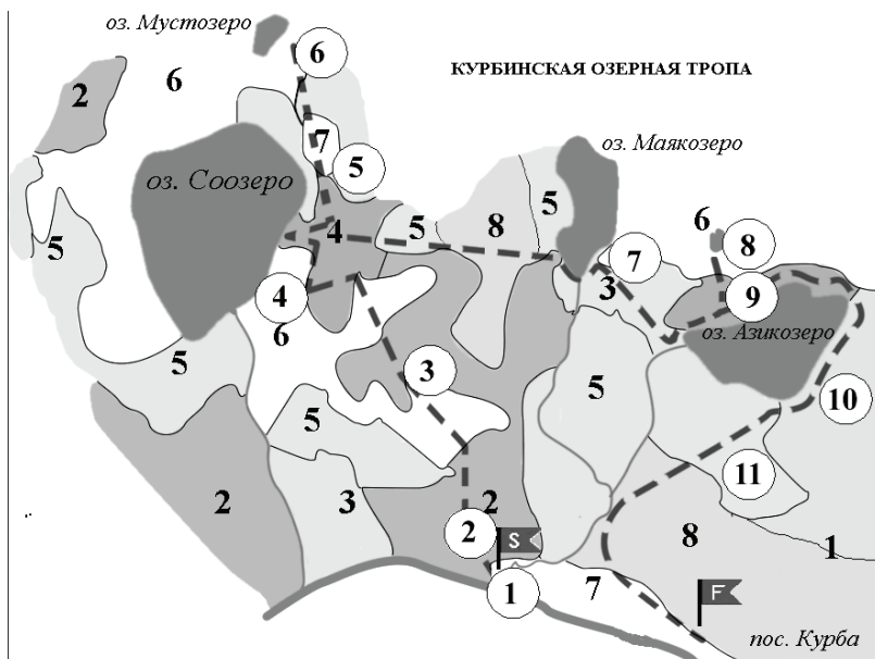
Рис. 3. Карта-схема Курбинской экологической тропы в природном парке «Вепский лес». А. Холмисто-грядовые моренные возвышенности: 1 – березово-еловые зеленомошные леса; Б. Волнистые и плоские водно-ледниковые и озерные равнины: 2 – березово-еловые леса; 3 – елово-березово-сосновые леса; 4 – березовые леса; 5 – сосняки сфагновые; 6 – сосново-сфагновые болота; 7 – суходольные луга (залежи). В. Холмистые камовые и водно-ледниковые равнины: 8 – сосновые леса. 9–11 – объекты на маршруте (см. табл. 16)

аттрактивность (привлекательность); устойчивость к антропогенным нагрузкам; доступность в транспортном отношении. Так, Курбинская озерная тропа (Природный парк «Вепский Лес») проложена в окрестностях пос. Курба (рис. 3, табл. 16).